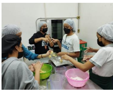
Taller de Panadería