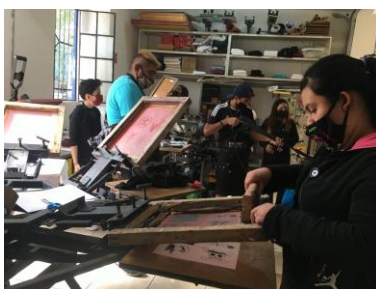
Taller de Serigrafía

Nuestro objetivo es brindar empleo y oportunidades de crecimiento profesional a nuestros usuarios.